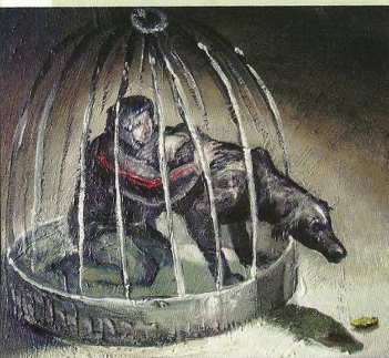
Dim gobaith caneri